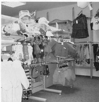
Ausgewähltes Sortiment, klare Gliederung, kreative Präsentation.