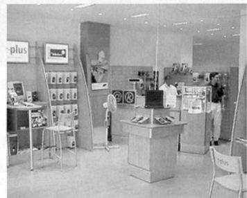
Moderne Branche, modernes Konzept: Beispiel für ein Unternehmen aus der Telekommunikation.