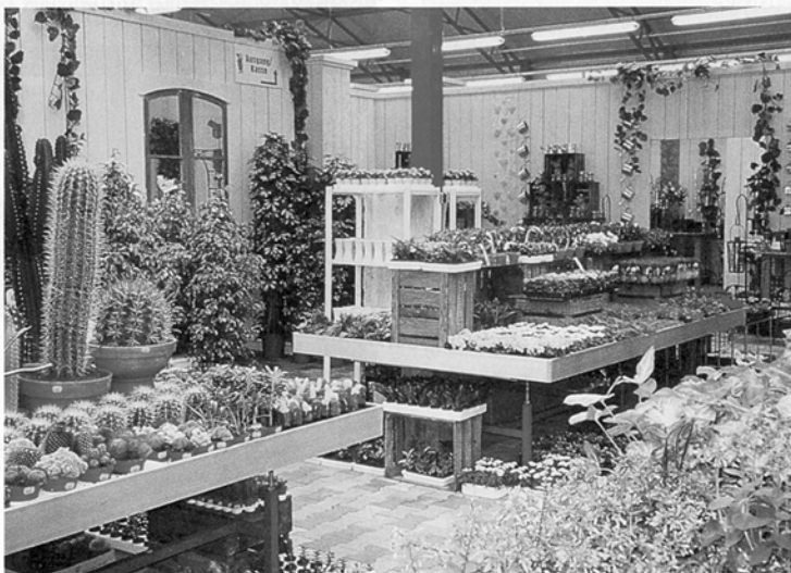
Vorbildliche Präsentation in einem Gartencenter.