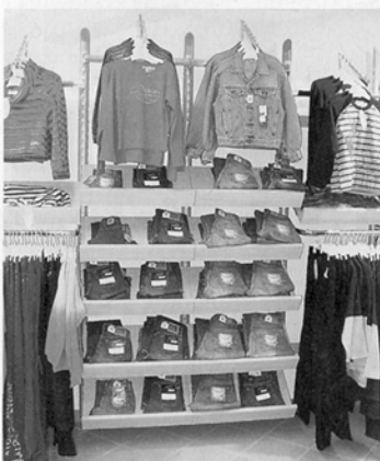
Attraktives Warenbild in einer Kindermode-Boutique.